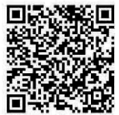
線上檢定示範 及上傳方式