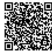
線上檢定流程 及注意事項